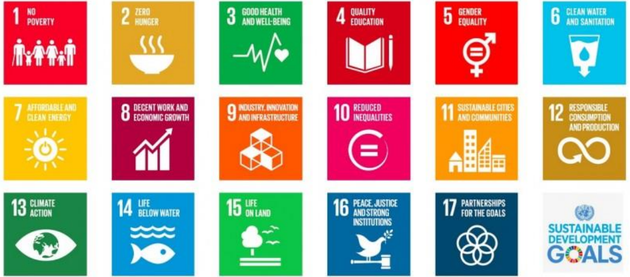
চিত্রঃ এসডিজি লক্ষ্যমাত্রা